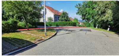
Burisholzweg, Niederscherli NACHHER: Einfache Massnahme mit grosser Wirkung. Die Eibe links wurde entfernt. Damit konnte die Sicht auf querende Zufussgehende wiederhergestellt werden. (Foto vom 29.06.2022)