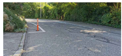
Burisholzweg, Niederscherli NACHHER: Rückmeldung der Schulkinder: «Strasse queren ist schwierig». Eine Abweislinie und ein Poller verengen die Fahrbahn und reduzieren das Tempo. Der Fussgängerschutz und die gegenseitige Sicht beim Queren konnte verbessert werden. (Foto vom 29.06.2022)