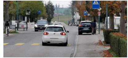
Schwarzenburgstrasse, Niederscherli VORHER: Der Kanton prüft die geforderten Verbesserungen im Rahmen des geplanten Deckbelagsersatzes (voraussichtlich 2025 oder 2026). Zur Debatte stehen beispielsweise eine Temporeduktion, durchgehende Velostreifen und neue Fussgängerstreifen-Mittelinseln. (Foto vom 20.10.2022)