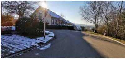
Burisholzweg, Niederscherli VORHER: Rückmeldung der Schulkinder: «Keine Sicht». (Foto vom 12.01.2022)