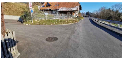
Haltenstrasse, Niederscherli VORHER: Rückmeldung der Schulkinder: «Wir müssen auf der Strasse laufen ohne Trottoir». (Foto vom 12.01.2022)

Klicken Sie auf die Bilder, um eine grössere Bildansicht zu erhalten.